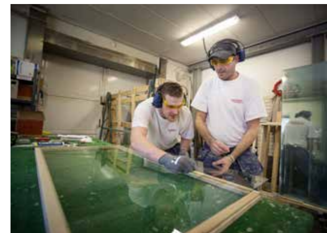
Fönsterrenoverare är ett bristyrke. Eftersom specialutbildningar saknas utbildar Fog & Fönsterservice AB alla anställda i egen regi. Bara i år har fem ungdomar från Ung i Nynäsprojektet fått anställning.