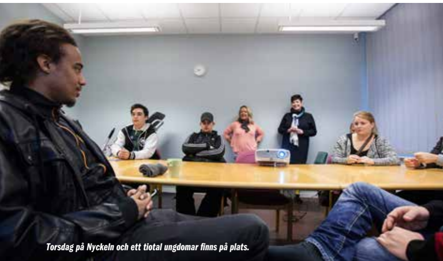
Torsdag på Nyckeln och ett tiotal ungdomar finns på plats.

”Många av ungdomarna behöver vänja sig att befinna sig i en grupp. Det ger en möjlighet att reflektera över sig själv och sin situation i ett forum tillsammans med andra.”